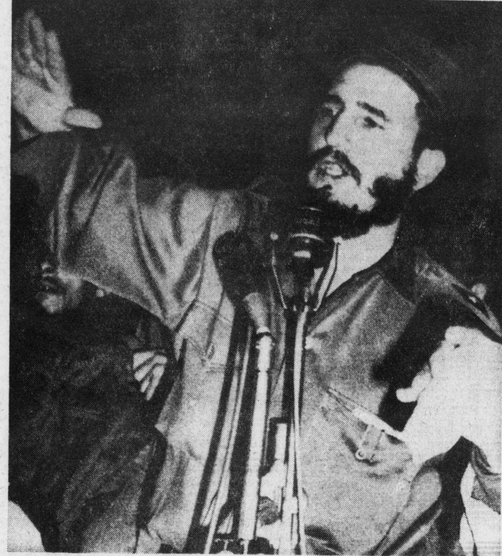
FIDEL CASTRO, Primer Ministro